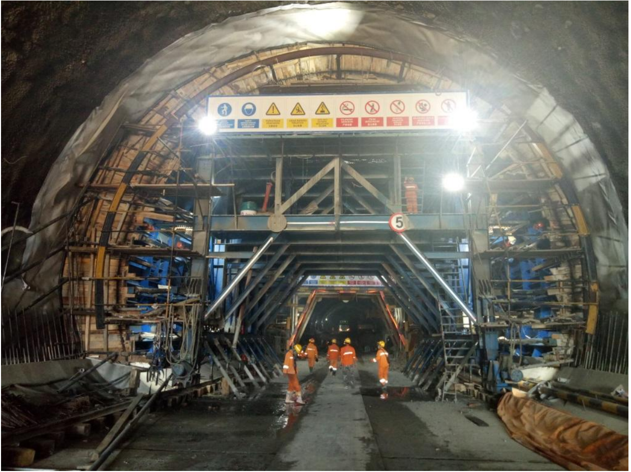
雅万高铁施工现场