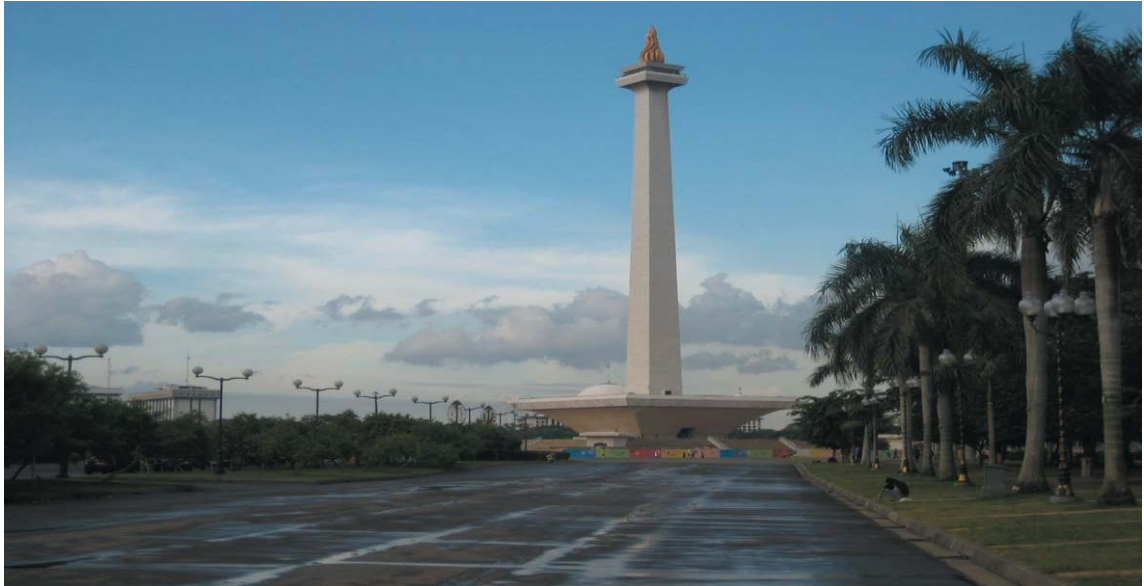
印尼独立纪念碑广场

印尼实行总统制，总统既是国家元首，也是政府首脑，同时掌管三军。总统、副总统均由全民直选产生，任期5年，总统可连任一次。现任总统为佐科·维多多，副总统为马鲁夫·阿敏，本届内阁于2019年10月组建，任期至2024年。