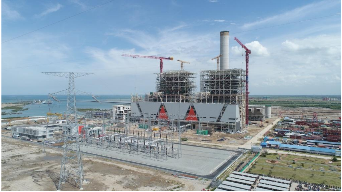
华国华印尼爪哇7号项目