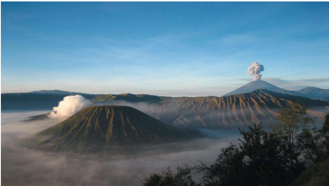
印尼著名的活火山—BROMO火山

印度尼西亚（以下简称印尼）位于亚洲东南部，由太平洋和印度洋之间的17508个大小岛屿组成，是世界上最大的岛国、最大的群岛国家，国土面积191.4万平方公里，海洋面积316.6万平方公里（不包括专属经济区）。包括苏门答腊岛、爪哇岛、苏拉威西岛以及婆罗洲和新几内亚的部分地区。与巴布亚新几内亚、东帝汶、马来西亚接壤，与泰国、新加坡、菲律宾、澳大利亚等国隔海相望。