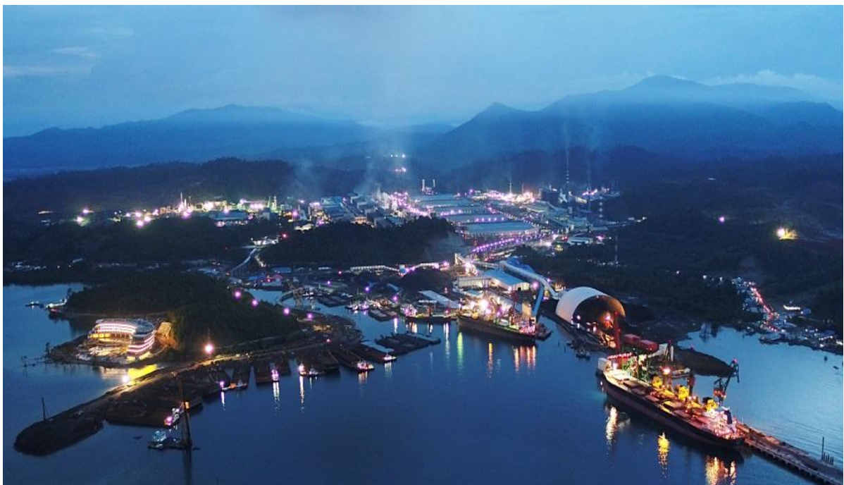
中国企业在印尼投资的青山工业园