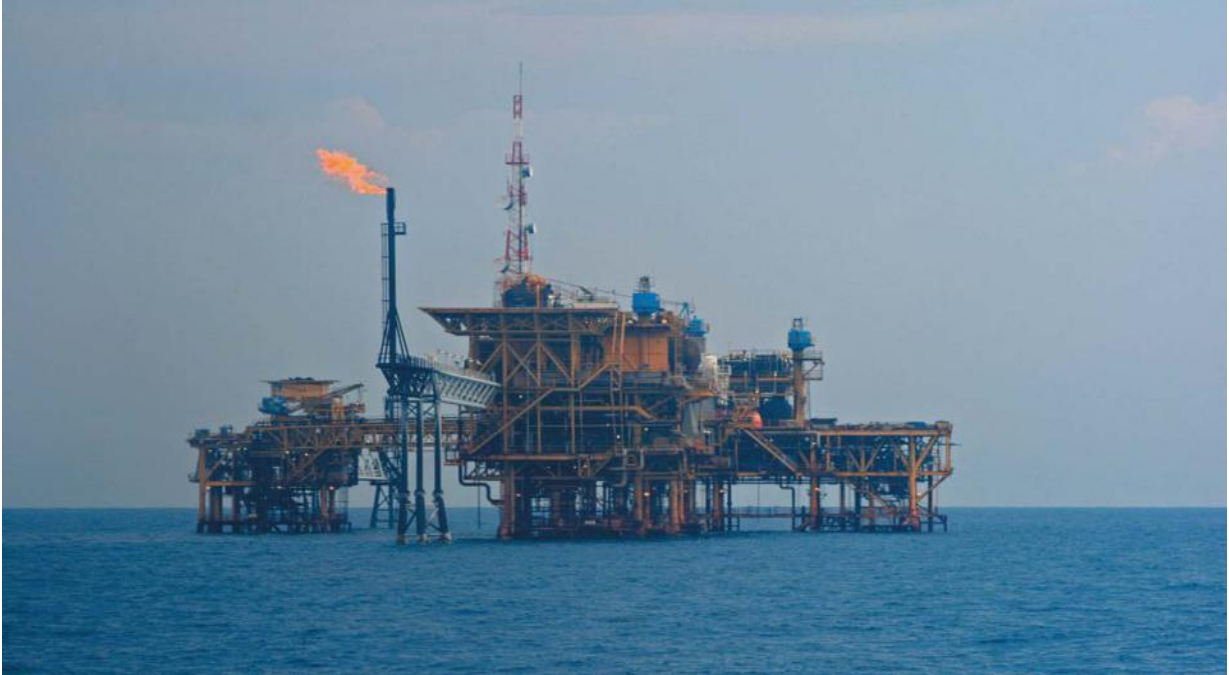
中海油在印尼的作业平台