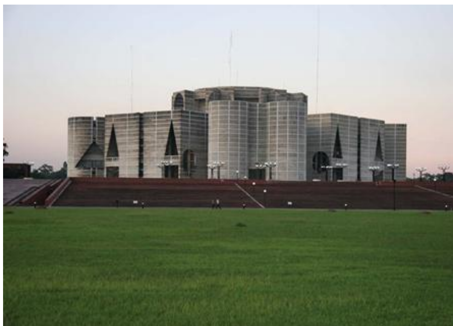
孟加拉国国议会大厦

【议会】孟加拉国议会实行一院议会制，即国民议会。宪法规定议会行使立法权。议会有350名议员，包括300名按选区直接由选民选举产生的议员，以及50名由当选议员间接产生的女性议员（专门为女性设置的保留席位）。议员每届任期5年。议会设正、副议长，由议员选举产生。2018年12月30日举行第11届国民议会选举，哈西娜领导的人民联盟获得压倒性胜利，获257个议席，民族党（艾尔沙德派）获22个议席，成为议会第二大党，2019年1月3日议员们宣誓就职，1月30日，上届议长希林·夏尔敏·乔杜里，再次当选议长并就职。议会还设有秘书处以及专门委员会等部门。