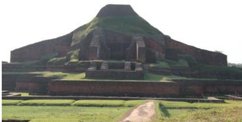
帕哈尔普尔佛教寺院遗迹