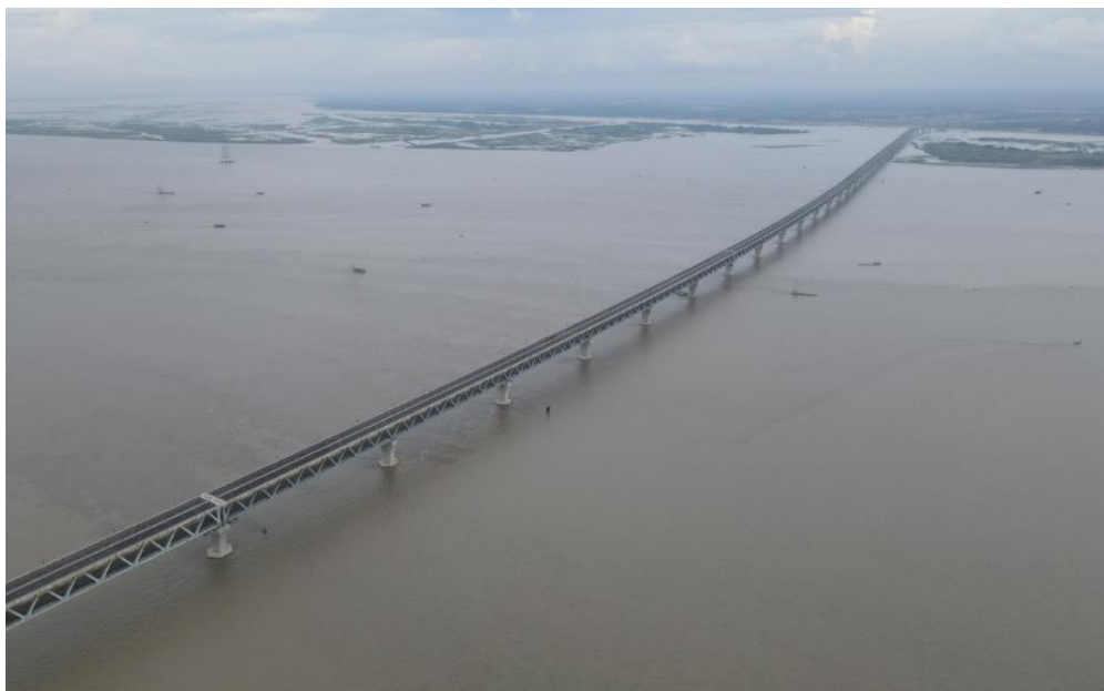
已建成通车的帕德玛大桥