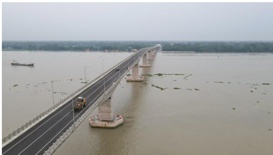
已经建成的友谊八桥项目

【中孟避免双重征税协定】 1996年9月12日，中国与孟加拉国签署了《关于对所得避免双重征税和防止偷漏税的协定》。