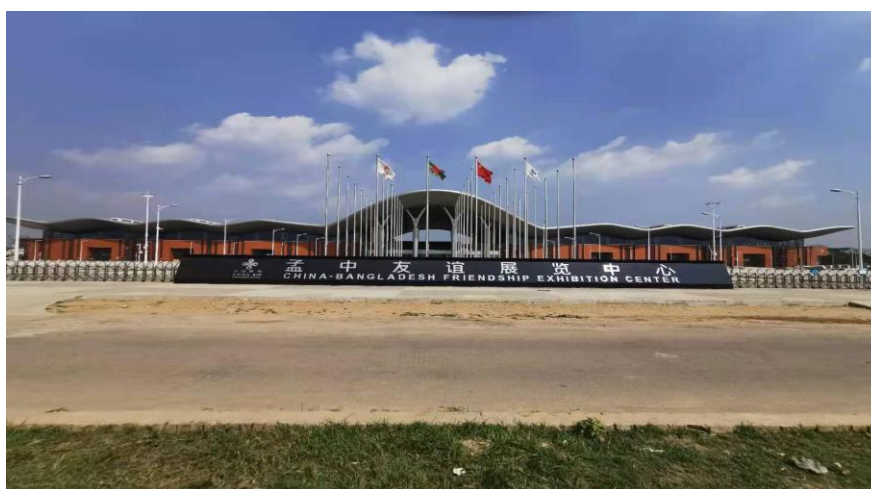
已经建成的孟中友谊展览中心