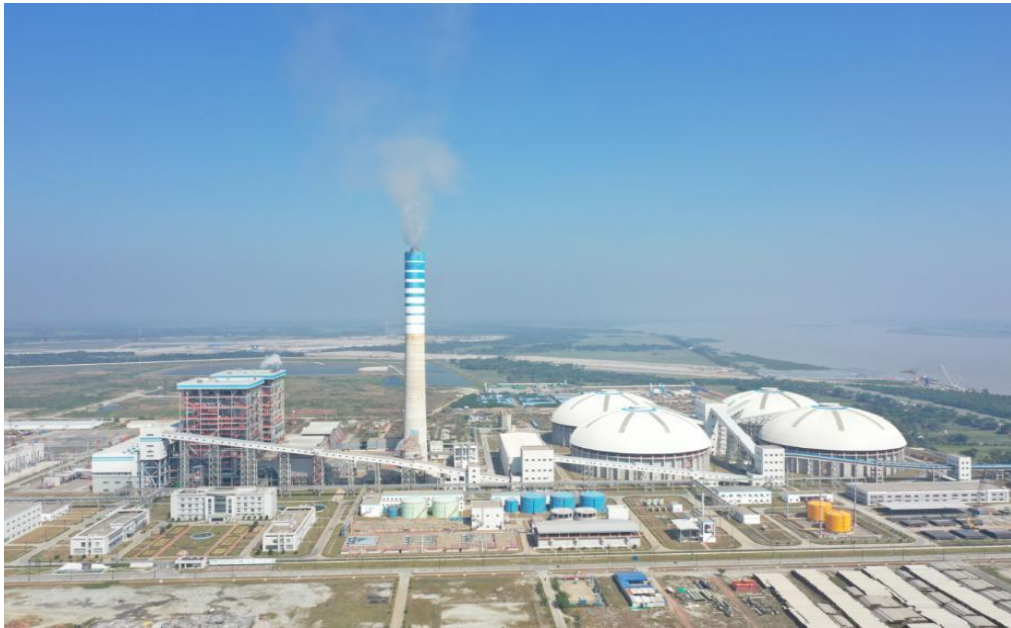
已建成的帕亚拉1320MW燃煤电站

款项目，如中国机械进出口有限公司的达卡至阿苏利亚高速公路项目；投建营一体化的PPP合作项目，如山东高速投资的达卡机场快速路项目；以及其他常规的承包工程项目。