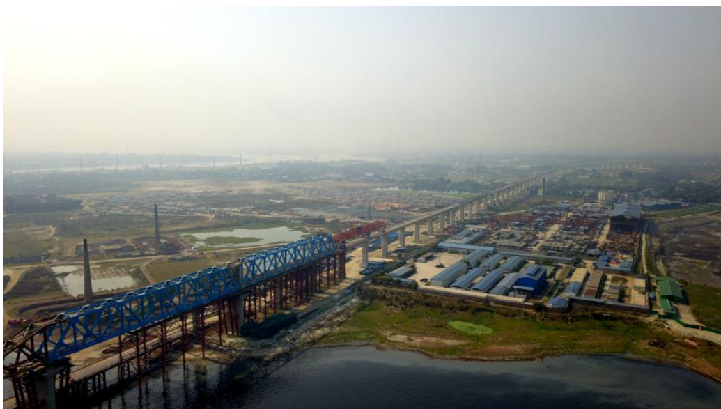
建设中的帕德玛大桥铁路连接线项目