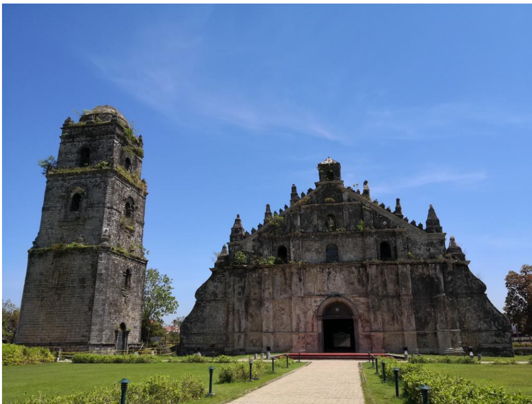
菲律宾抱威教堂，联合国非物质文化遗产名录

根据菲律宾统计署数据，菲79.5%的人口信奉天主教，6%信奉伊斯兰教，2.6%信奉基督堂教会（Iglesia ni Cristo）。