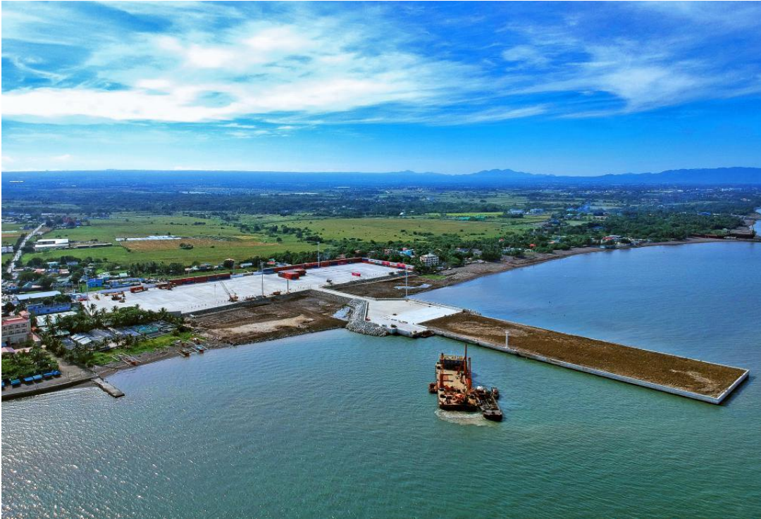
菲律宾甲米地集装箱转运码头升级改造项目（中国港湾承建）

据中国商务部统计,2021年中国企业在菲律宾新签承包工程合同545份,新签承包工程合同额111.1亿美元,同比增长15.7%;完成营业额32.5亿美元,同比增长15.7%;期末各类在外劳务人员2974人。