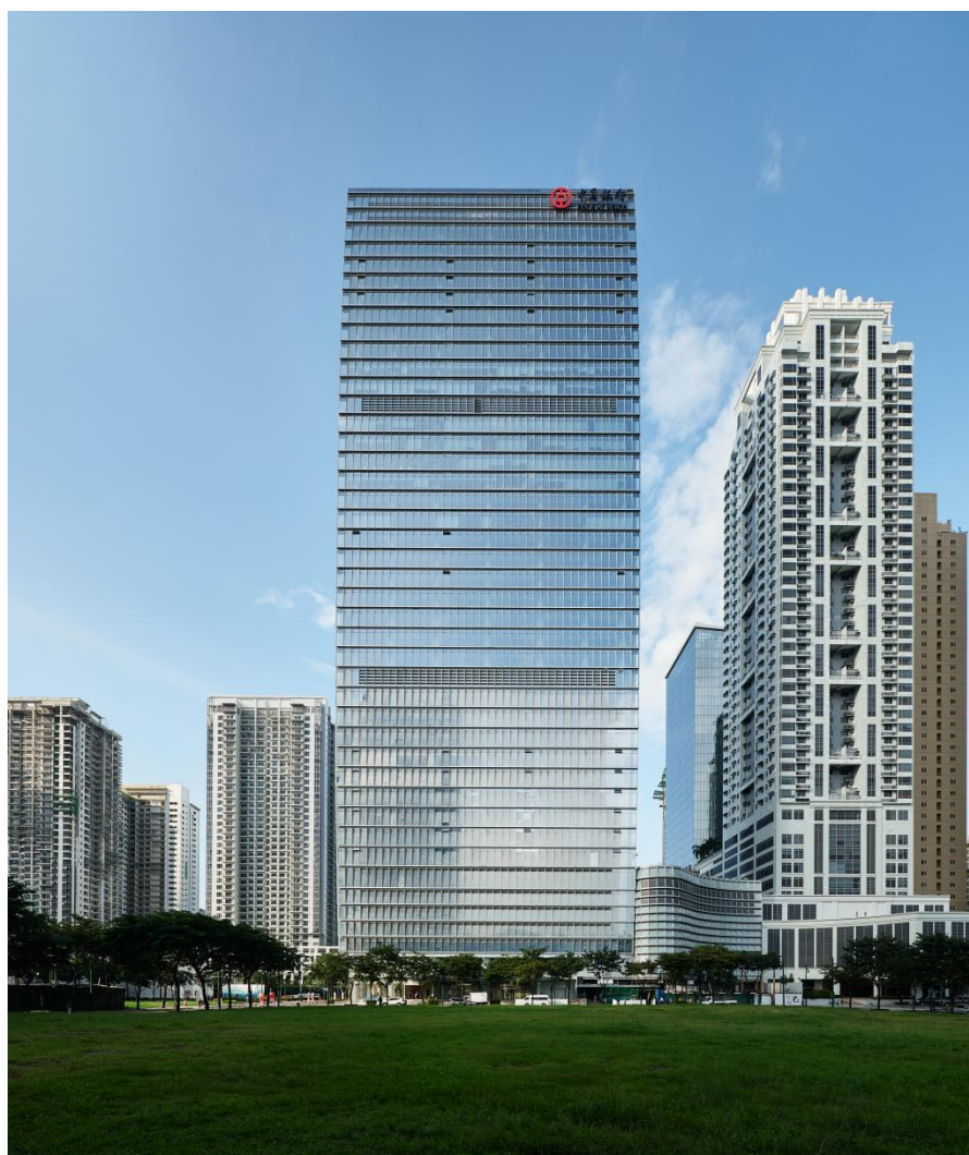
中国银行马尼拉分行