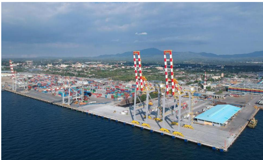
菲律宾八打雁港口

菲律宾水运航线总长3219公里，共有400多个主要港口。大多数港口需要扩建和升级，以容纳大吨位轮船和货物。菲律宾的集装箱码头设施完善，能高速有效地处理货运。