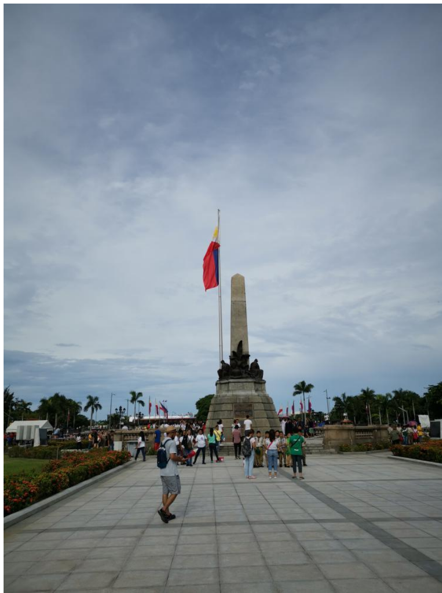
菲律宾马尼拉黎刹广场

首都是“大马尼拉”（Metro Manila），由17个市（区）组成，面积638平方公里，人口1500万。